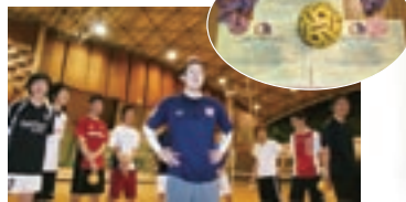
千葉大でクラブのメンバーと

セパタクローをやってみたいと思った方は、ホームページ内のプロフィールにあるクラブのメールアドレスにご連絡ください。