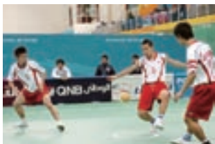
2006年アジア大会（ドーハ）

亜細亜大学に進学し、セバタクローと出会う。大学3年時にナショナルチームに選ばれ、2006年アジア大会（ドーハ）に出場。今年7月にタイで開催されたセバタクロー世界選手権「KING'S CUP」で銅メダルを獲得。