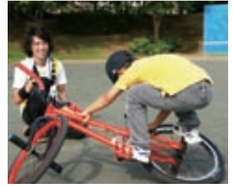
集まってきた子どもに技を指導

A 海外で開催される世界大会に出場すること。自分のパフォーマンスで、観客のみんなに喜んでもらうことです！