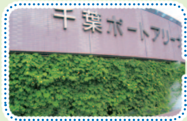
(財)千葉市スポーツ振興財団事務局(千葉ポートアリーナ内)の窓側に、みどりのカーテンを設置しました

旧ホームページは、皆様に各イベント・教室案内等を知って頂くための広報手段として長くご愛顧いただきました。新ホームページは、お客様の使いやすさと、わかりやすさ等、利便性の向上をテーマに一步発展したホームページになっております。今後も皆さまにご活用いただけるホームページをめざし、継続した取り組みを進めてまいります。