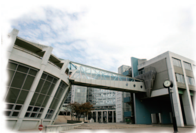
(吉田選手の母校 千葉県立幕張総合高等学校)

高校時代は戦術などはあまり考えていなかったのですが大学に入りそして日本代表になり、頭で考えてプレイをするようになり、さらに水球の魅力を感じる様になりました。